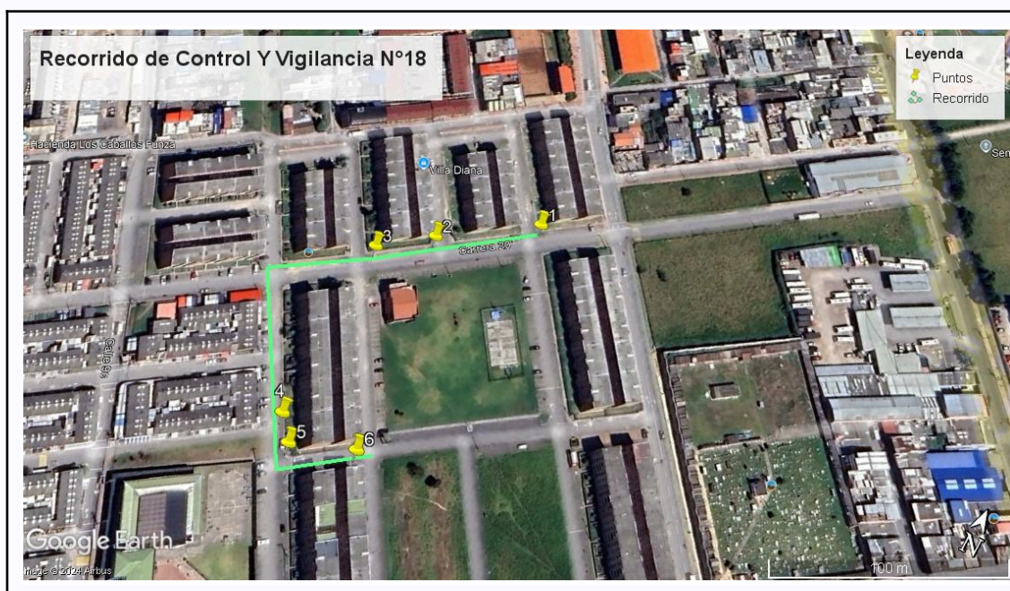
Ilustración 1. Recorrido de Control Y Vigilancia N°18

Con base en lo anterior, el día 22 de octubre del 2024 se realizó recorrido de control y vigilancia en el barrio Villa Diana, cuadrante 3 desde las coordenadas 4°43'16,002" N- 74°12'57.828"W hasta las coordenadas 4°43'11,58"N- 74°12'58,434"W(ver ilustración 1. Ruta verde)