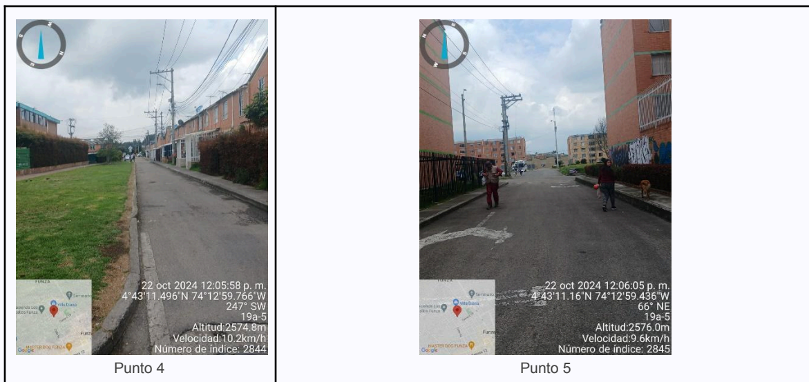
Ilustración 2. Fotos de los puntos del Recorrido de Control Y Vigilancia.